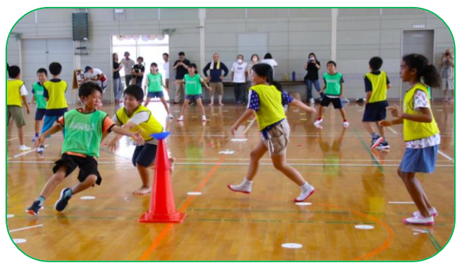
スポーツ鬼ごっこ

河東小学校体育館において、「みんなでスポーツを楽しもう」と題して、インストラクター4人の指導によるスポーツ鬼ごっこをしました。(参加25人) 体育館の中は暑かったのですが、子ども達はインストラクターの話をよく聞いて、前半はソフトテニスをし、後半はスポーツ鬼ごっこをして、休憩や水分補給をしながら大歓声を上げて走り回っていました。見ていた大人も、子どもの笑顔や歓声に手をたたいて応援していました。 子ども達は怪我もなく、楽しかったと言って笑顔で帰っていきました。 お手伝いいただきました役員や保護者の方にお礼申し上げます。(青少年育成部会)