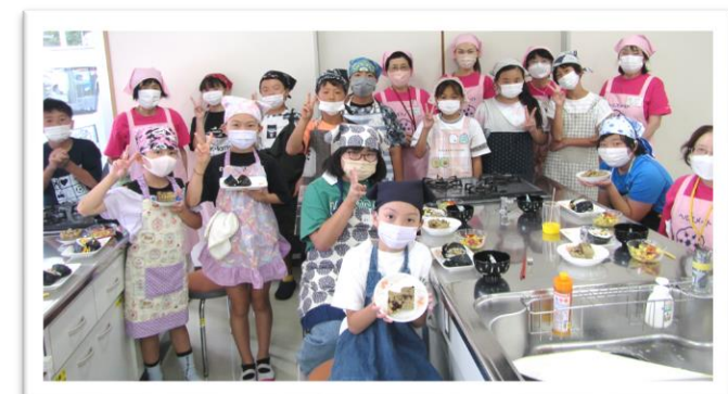
河東コミセン 8月8日