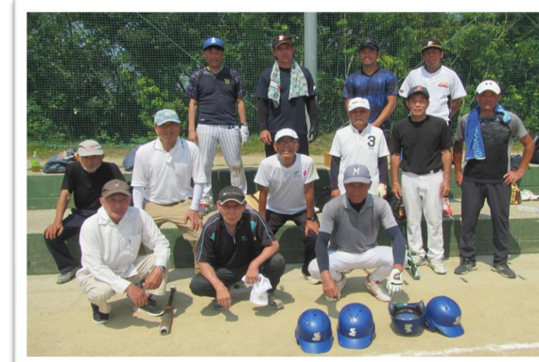
優勝した城西ヶ丘Bチームのみなさん